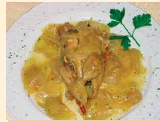
Perdiz Estofada 1958

En un entorno tranquilo y confortable podrá disfrutar de una placentera comida o de una exquisita cena. En pocas palabras, el mejor sitio donde disfrutar de la cocina de la tierra. Además si lo prefiere, en la barra, podrá degustar un amplio surtido de tapas y raciones.