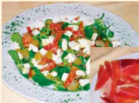
Ensalada de Canónigos con surtidos ahumados, queso blanco de cabra y uvas